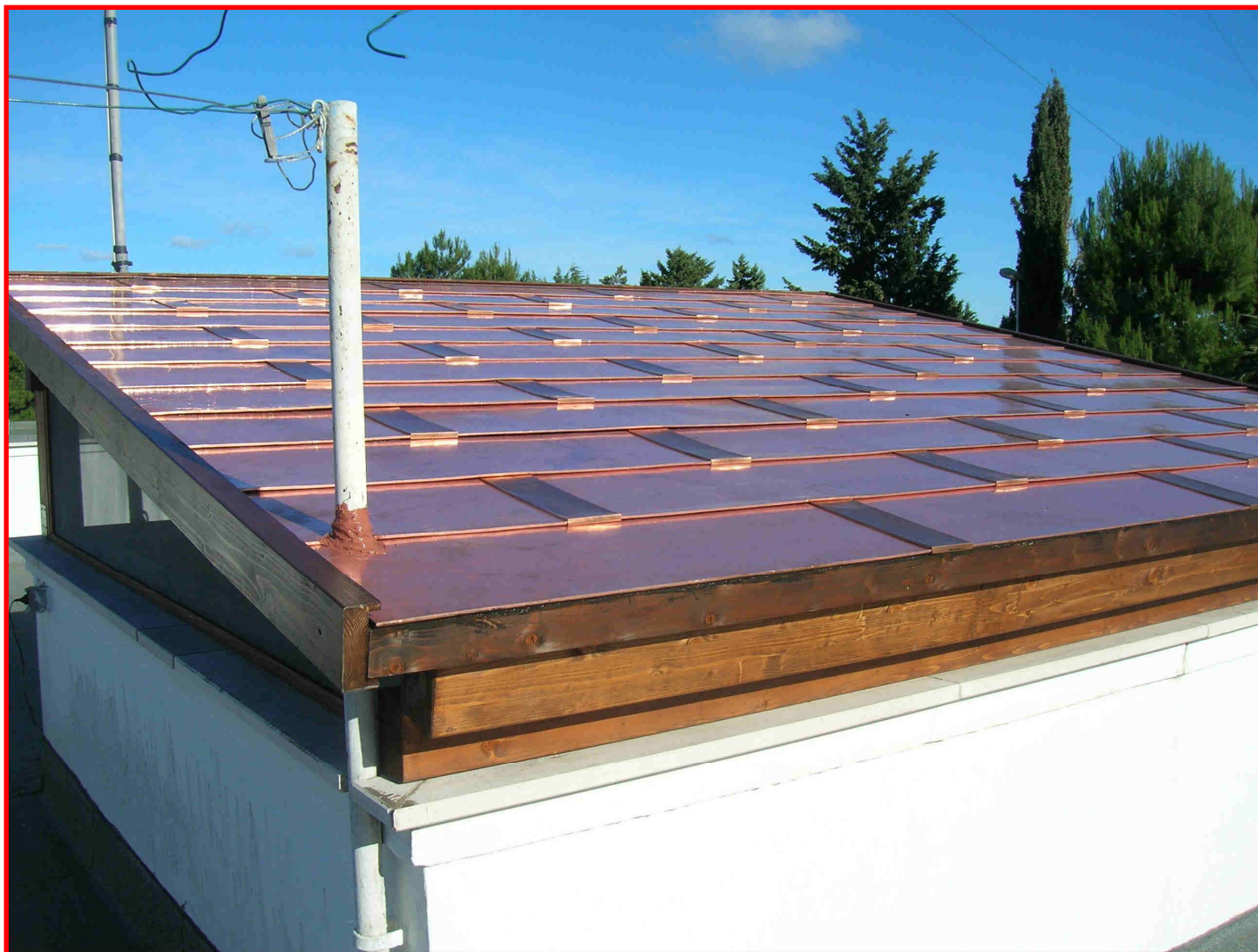
TETTO IMPERMEABILIZZATO CON TEGOLA CANADESE "IN RAME"