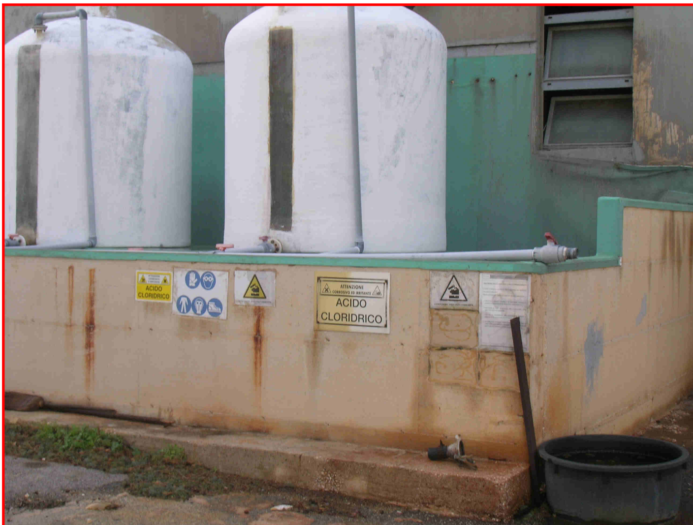
IMPERMEABILIZZAZIONE VASCA INDUSTRIALE CONTENENTE ACIDO CLORIDRICO CON PVC ARMATO DI TREVIRA