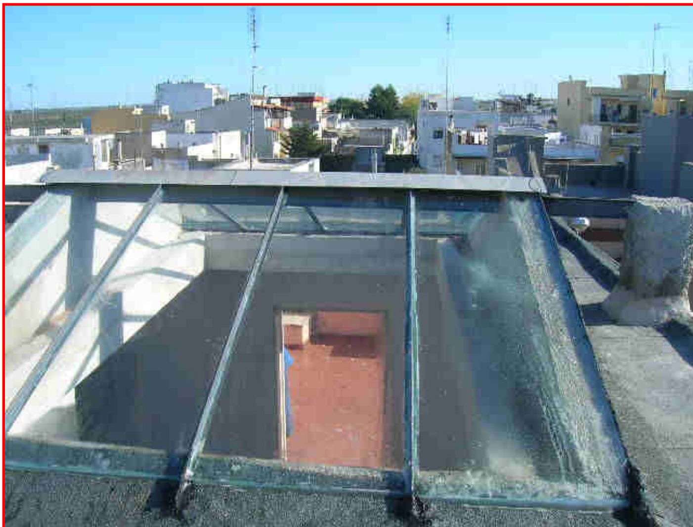
SMALTIMENTO VETRATE E REALIZZAZIONE NUOVO POZZO LUCE CON VETRO DI SICUREZZA VISARM